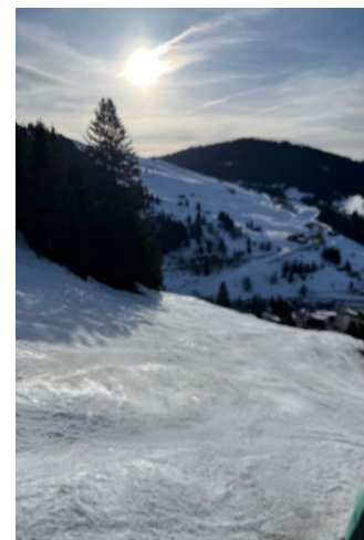
Dévers Combes des juments