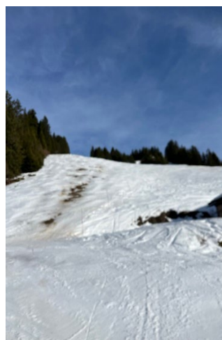
Combes des juments