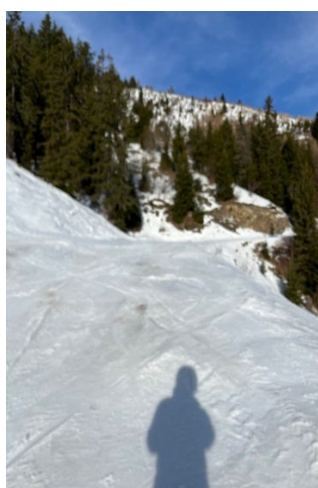
Liaison Les Mélèzes